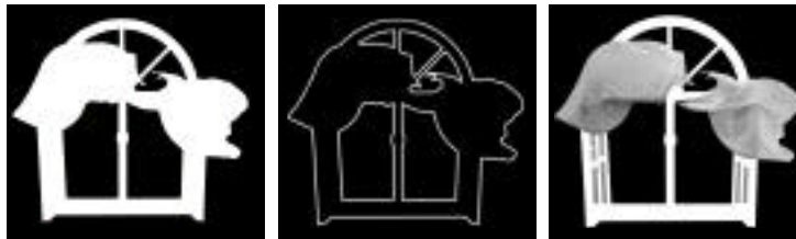
アルファチャンネルクリッピングパスTransflectanceチャンネル